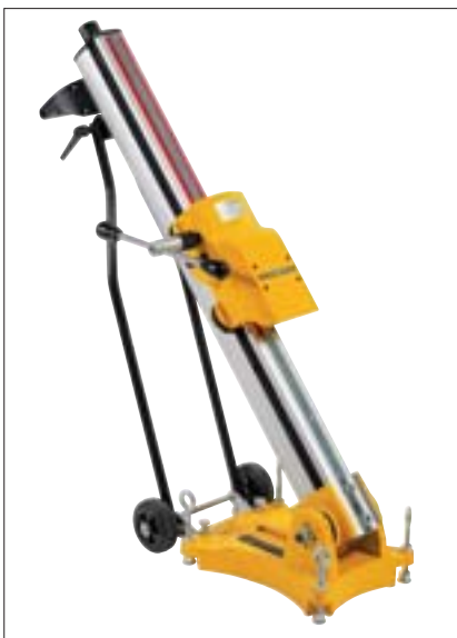
Bis 45° schrägverstellbar Inclining adjustable up to 45°