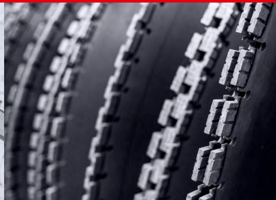
Diamantsägeblätter von Durch- messer 125 bis 2000 mm erhältlich