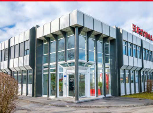
EURODIMA-Zentrale in Wals bei Salzburg