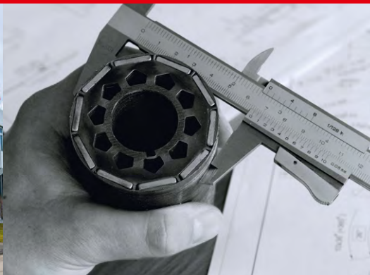
Eigene Forschung & Entwicklung für Werkzeuge und Maschinen