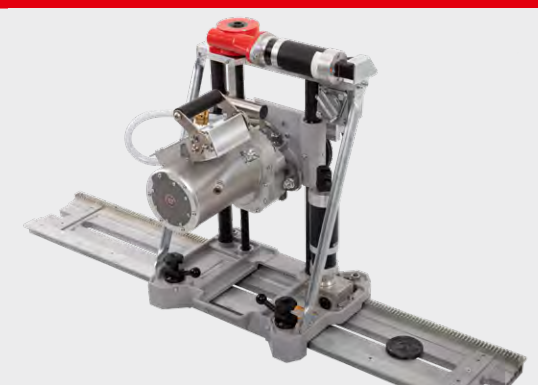
Eigens entwickelte Wand- und Seilsägesysteme mit unseren modularen Antriebseinheiten

Zentrale: EURODIMA GmbH & Co KG Lagerstrasse 6 AT-5071 Wals Tel. +43 662 42 42 48-0 / Fax -27 office@eurodima.com www.eurodima.com