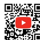
EURODIMA Wandsäge WM50 / WM90 Aufbau und Funktionstest